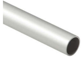
Garde-Corps Galva D34 mm