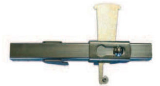
Bride d'alignement / Bride d'alignement Variable