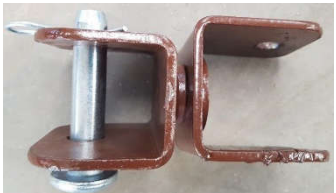
Tête pour étais Tirant - Poussant