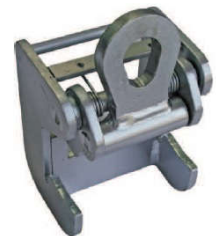
Crochet de levage automatique