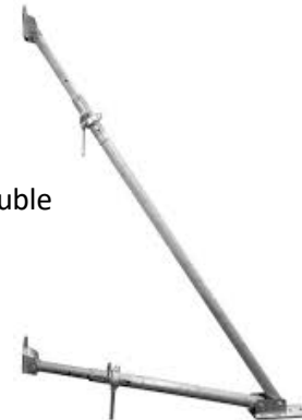
Etais tirant – Poussant double