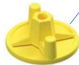
Plaque écrou 110 mm